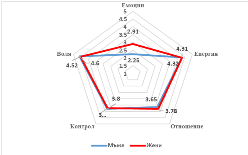
Фигура 2. Средни стойности мъже – жени